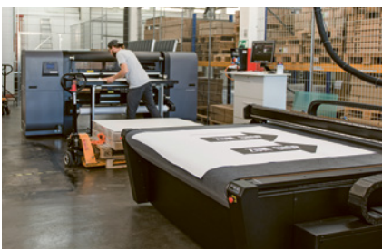
Kromer Promotions AG