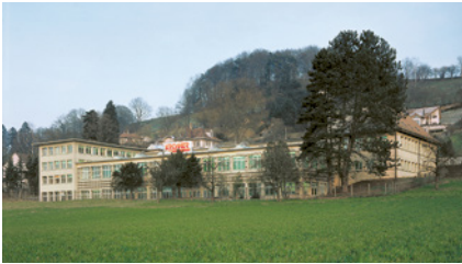
Kromer-Haus am Unteren Haldenweg 12