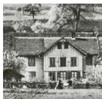
Liegenschaft der ersten Generation Kromer an der Hendschikerstrasse