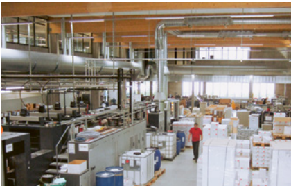
Liegenschaft in der Industrie Gexi