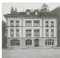
Liegenschaft der zweiten Generation Kromer am Kronenplatz 12